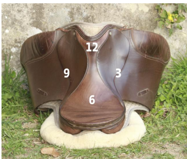
Vorderzwiesel 12 – Hinterzwiesel 6. Mit der Einteilung des Sattels mit Hilfe des Zifferblatts der Uhr ist klar beschreibbar, wohin uns das Pferd bewegt.

An erster Stelle muss die bereits beschriebene Sitzschulung stehen, die den Reiter den Sitz „in“ die Pferdebewegung finden lässt. Und das, bevor sich Reitlehrer und Reitschüler ins Leichttraben flüchten, ohne dass der Schüler vorher das Aussitzen des Trabes gelernt hat! Hat der wenig routinierte und deshalb nicht wirklich losgelassen sitzende Reiter erst einmal gelernt, sich der Erschütterung des Trabes durch Leichttraben zu entziehen, ist es ungleich schwerer, im Aussitzen wieder in die