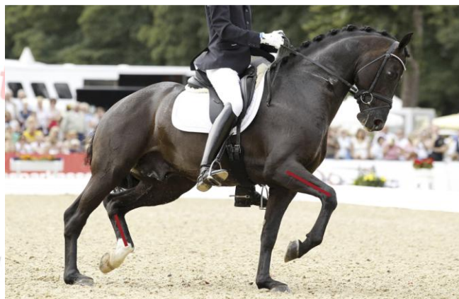
Deutlich sichtbare gebrochene Diagonale bei einem völlig verspannt gehenden Pferd.

Ein Pferd, das im Trab NICHT im Rücken aufschwingt, ist – solange es ruhig trabt – gar nicht so schlecht zu sitzen. Der Reiter wird nicht sonderlich erschüttert, da das Pferd den Rücken schlicht „festhält“. Lediglich die Gliedmassen des Pferdes leisten die Arbeit es im Trab vorwärts zu bewegen. Der Rücken bewegt sich so gut wie nicht. Die diagonale Fußfolge ist hierbei häufig nicht sicher gegeben und es kommt auch nicht zur Schwebephase. Hält ein solcher „Schenkelgänger“ auch noch