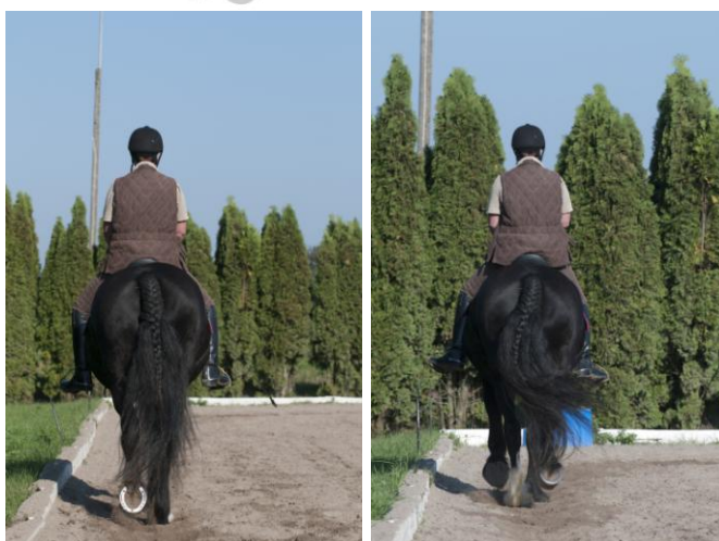
Richtig aussitzen – linkes Bild: 9 Uhr im Trab – rechtes Bild: 3 Uhr im Trab

Positiv empfundene, wenn auch falsche Bewegungsmuster werden dabei natürlich schneller abgespeichert als korrekte, aber trainingsintensive Bewegungen. Ist ein Muster „fest installiert“, weil es gut funktioniert, ist es nicht einfach, es wieder zu ändern, zu ergänzen oder gar zu ersetzen.