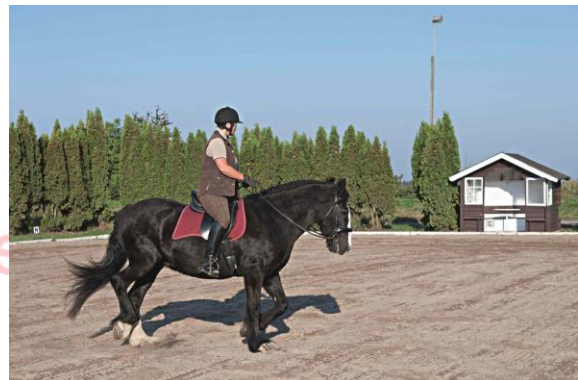
Leichttraben auf den linken, inneren Hinterfuß

Im Umkehrschluss kann ich so auch ein schwächeres Bein schonen, wenn die Reha nach einer Verletzung zum Beispiel noch nicht sehr weit fortgeschritten ist.