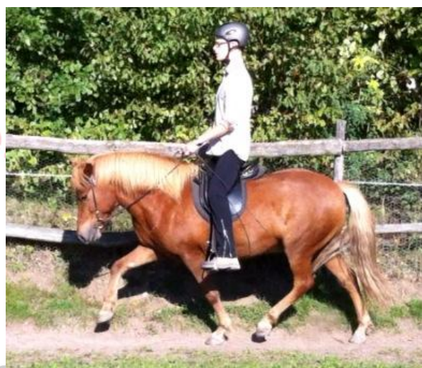
Optimale Schwungförderung durch exakt dosierte positive Spannung im Erheben.

Einem Pferd, das nicht über einen sicheren Zweitakt verfügt, kann ich als Reiter nur dann mit dem Leichttraben helfen, wenn ich genau weiß, wann und wie ich damit seinen Schwung intensiviere. Bin ich mir nicht sicher, genau das zu beherrschen, ist es erst einmal sinnvoller, ein Gleichmaß im natürlich angebotenen Gang (oder gebrochenen Zweitakt) zu suchen und anzustreben, statt einen noch nicht sicheren Takt manipulieren zu wollen.