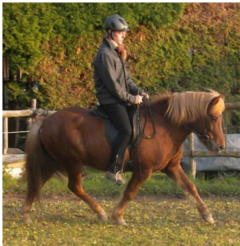
Geschmeidiger Sitz – geschmeidiges Pferd

Gerade bei Gangpferden, die im Trab nicht immer selbstverständlich über zwei gleichmäßig agierende Diagonalen und eine klare Schwebephase verfügen – wie übrigens auch mancher Dreigänger – ist es für den Reiter anfangs schwierig, „zweckmäßig“ leicht zu traben. Zweckmäßig in dem Sinne, dass Pferd und Reiter vom Leichttraben profitieren!