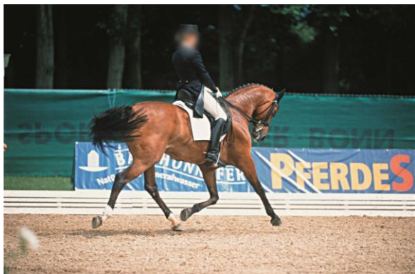
Eine durch den Sattel fixierte Reiterin mit schiebendem Sitz und klemmendem Knie

Weg suchen. Der Knieschluss ist im leichten Sitz und zum Springen angebracht und in Krisensituationen hilfreich. Beim losgelassen gehenden Pferd ist er aber ein Sitzfehler!