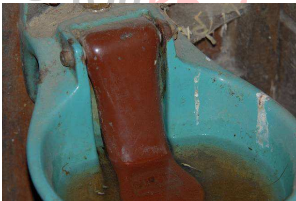
Diese Tränke ist eine typische "Schmutzecke", aus der kein Pferd trinken sollte.

Das sind nach meiner Erfahrung zunächst einmal tatsächlich alle (räumlichen) „Ecken“, sowohl in Ställen als auch in Sattelkammern – gefolgt von Kraftfutterkrippen. Besonders seit Ölzufütterung „in“ ist, verkleben sich die Reste „schön“ in den Futterkrippen. Danach kommen aber gleich die Tränkebecken und Kübeltränken.