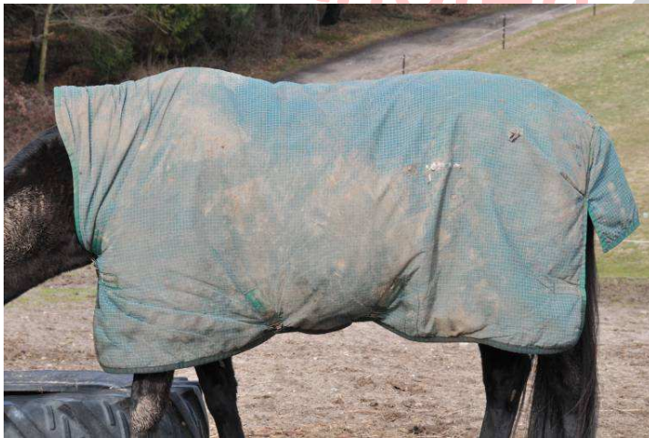
Pferdedecken werden arg strapaziert. Von außen und innen. Regelmäßige Reinigungen gehören zu den sinnvollen Hygienemaßnahmen.

Wenn man Hygienemaßnahmen „auf die Spitze treiben würde“ und täglich mit der