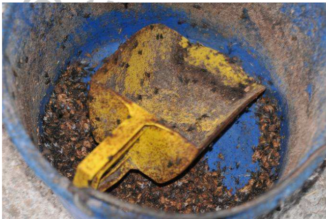
Ein völlig verklebter Futtereimer mit Futterresten ist ein Festmahl für Insekten und Brutstätte für Keime. Selbst wenn das Pferd hieraus nicht direkt frisst sondern nur das hierin angemischte Futter in den Trog bekommt.

Das individuell richtige Maß an Hygiene und die erforderlichen einzelnen Hygienemethoden richten sich nach Art der Haltung und Nutzung sowie nach Alter, Verfassung und Futterzustand des bzw. der zu betreuenden Pferde(s).